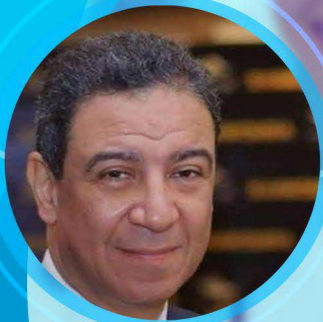
Prof. Maged Abdel Naseer

الاثنين 4 مايو 2020 - الثلاثاء 5 مايو 2020 الساعة التاسعة مساء ا